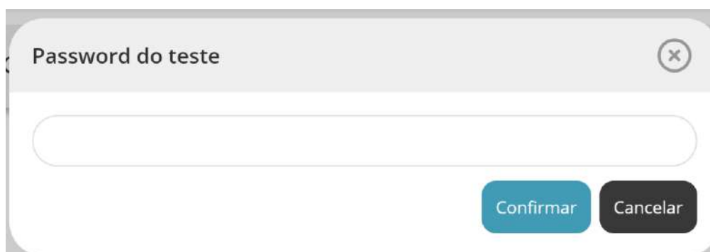
Figura 3 – Pedido da senha de acesso à prova a realizar

5.11. Depois de aceder à prova é solicitada a senha de acesso à prova. Inserindo a senha de acesso e pressionando o botão “Confirmar” a prova é iniciada.