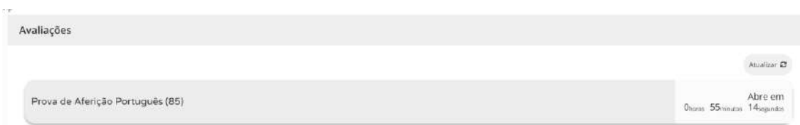
Figura 2 – Acesso à prova a realizar

5.8. Nas restantes provas ao clicar em “Iniciar sessão”, por exemplo, para um aluno que realiza a prova de aferição de Português (85), aparece o seguinte ecrã: